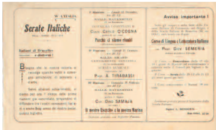
Fig. 9 - Volantino delle "Serate Italiane", 1913-14 (ASBR, Fondo Belga).