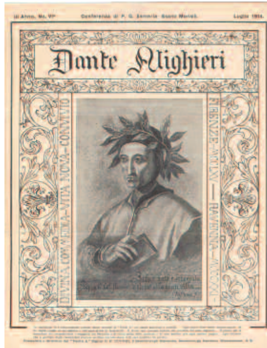
Fig. 8 - «Dante Alighieri», Anno III, n° VI, Luglio 1914, La Conferenza su Giovanni Pascoli di Padre G. Semeria (ASBR, Fondo Belga).