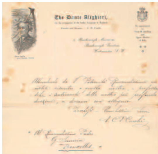
Fig. 7 - Particolare finale della lettera di Cesare Cucchi, da Londra, 13 maggio 1914, al P. Giovanni Semeria in Bruxelles (ASBR, Fondo Belga).