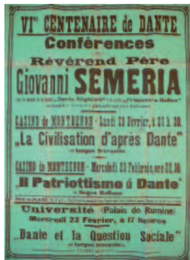
Fig. 13 - VI me Centenaire de Dante, manifesto della due Conferenze tenute a Losanna, sous les auspices de la Société "Dante Alighieri" et du Cercle "Primavera Italica", il 21 e il 23 febbraio 1921: Casino de Montbenon, La Civilisation d'après Dante , en langue française. Casino de Montbenon, Il patriotismo di Dante , in lingua italiana, Université (Palais de Rumine), Dante et la Question Sociale en langue française (ASBR, Fondo Belga).