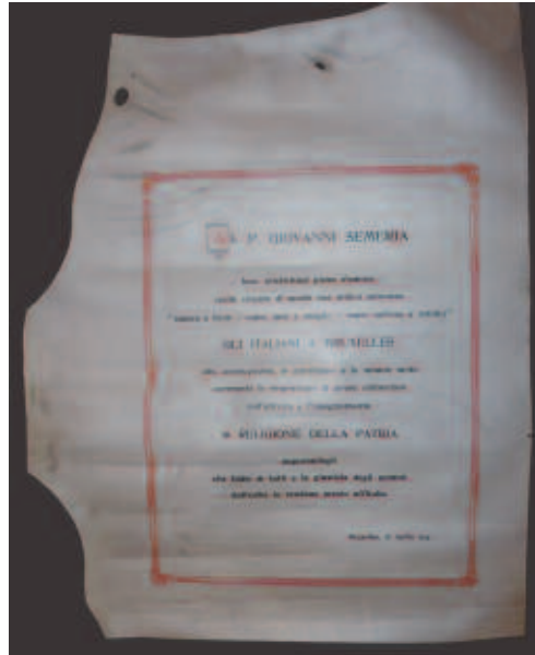
Fig. 12 - Pergamena omaggio al P. Giovanni Semeria da parte degli Italiani di Bruxelles, 28 aprile 1914 (ASBR, Fondo Belga).