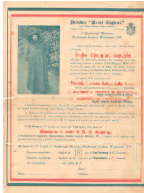
Fig. 6 - Volantino per la conferenza di P. Giovanni Semeria a Londra del 22 giugno 1914 (ASBR, Fondo Belga).