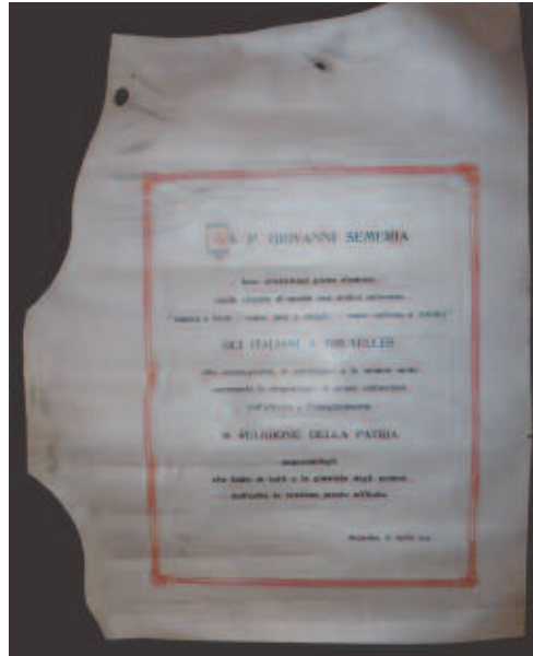
Fig. 12 - Pergamena omaggio al P. Giovanni Semeria da parte degli Italiani di Bruxelles, 28 aprile 1914 (ASBR, Fondo Belga).