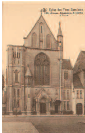
Fig. 2 - Sanctuaire de L'Enfant Jésus, Église des Pères Barnabites, 121, Avenue Brugmann, Bruxelles, La Façade (ASBR, Fondo Belga, Opuscolo fotografico, Ern. Thill, Bruxelles).