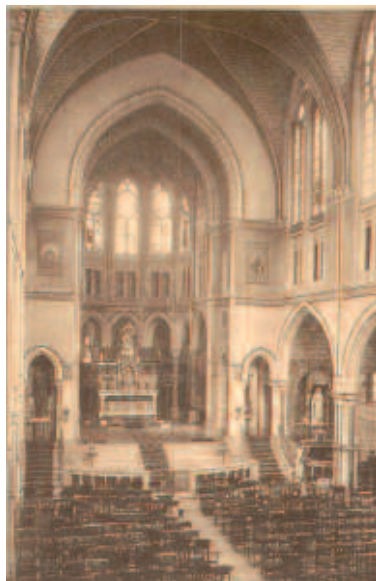
Fig. 3 - Sanctuaire de L'Enfant Jésus , Église des Pères Barnabites, 121, Avenue Brugmann, Bruxelles, L'Intérieur 1 .