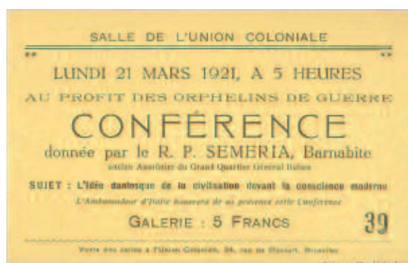
Fig. 11 - Bruxelles, Salle de L'Union Coloniale, 21 marzo 1921, L'idée dantesque de la civilisation devant la conscience moderne.