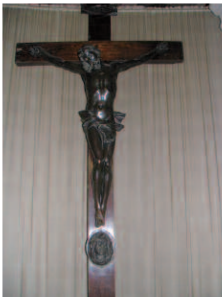
Fig. 15 -Interno della Chiesa L'Enfant Jésus . Il Crocifisso in bronzo, cesellato a San Pietroburgo, per molti anni fu il compagno inseparabile del conte Agostino Schouvaloff (†1859), convertito alla Chiesa cattolica e divenuto poi barnabita.