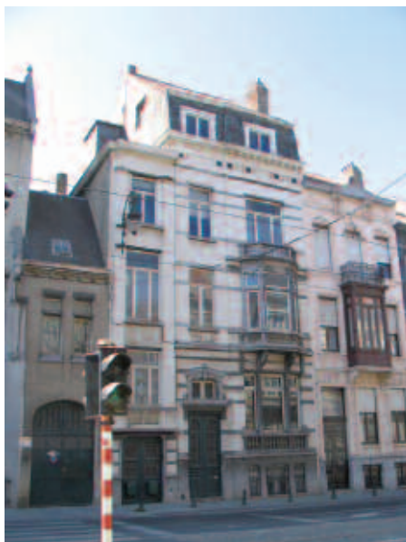
Fig. 14 - La Casa dei Padri Barnabiti a Bruxelles, Avenue Brugmann, 117. Accanto — sulla destra — al n° 115, la Casa delle consorelle Suore Angeliche.