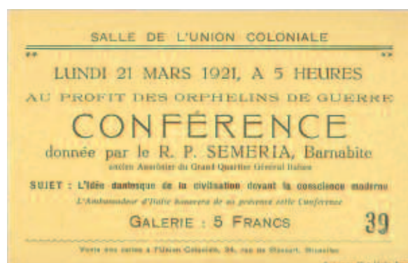
Fig. 11 - Bruxelles, Salle de L'Union Coloniale, 21 marzo 1921, L'idée dantesque de la civilisation devant la conscience moderne.